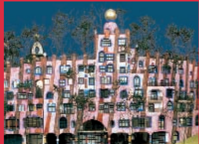
© Gruener Jänura AG 2004. Detailansicht/Modellfoto DIE GRÜNE ZITADELLE VON MAGDEBURG

Mit dem im Bau befindlichen Hundertwasserhaus am Breiten Weg entsteht in Magdeburg das letzte von Hundertwasser entworfene Gebäude „DIE GRÜNE ZITADELLE VON MAGDEBURG“. Die Größe des Gebäudes ist beeindruckend, denn es ist eines der größten von Hundertwasser geplanten Gebäude.